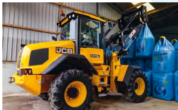
Obrázok 44: Špeciálny kolesový klíbový nakladač 413 S pri manipulácii s BigBagmi