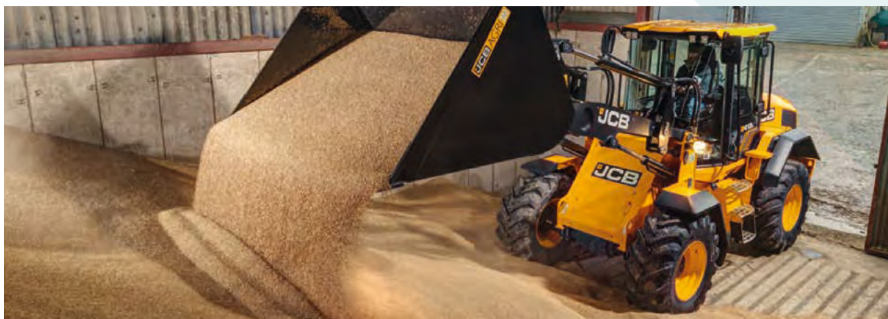
Obrázok 45: JCB 413 S Agri manipulácia s obilím