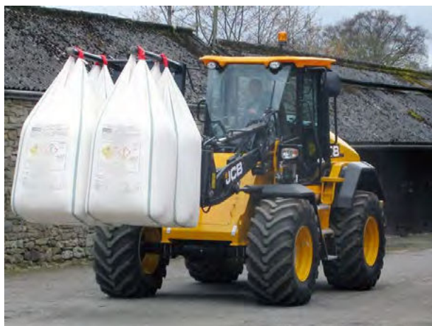
Obrázok 46: JCB 413 S Agri pri preprave BigBagov