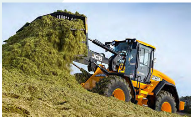
Obrázok 43: Špeciálny kolesový klíbový nakladač 435 S s rozhrňáčom siláže