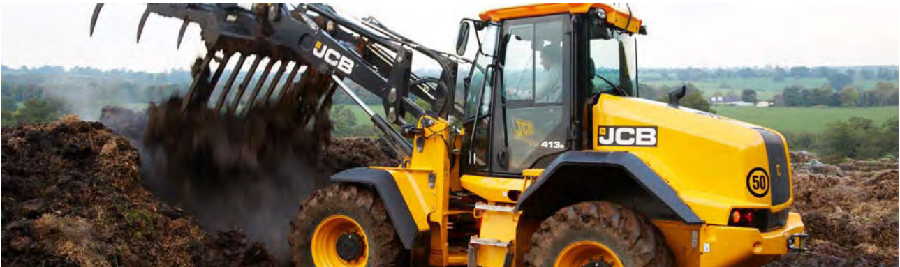
Obrázok 48: JCB 413 S AGRI