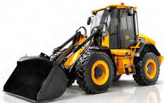
Obrázok 36: JCB 411 HT