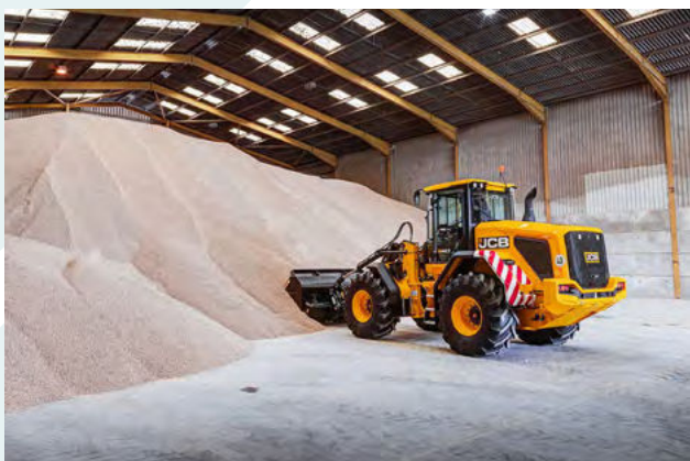
Obrázok 34: Práca s komoditami - JCB 427 HT AGRI

Klíbové kolesové nakladače HT AGRI sú predurčené na bezpečné a rýchle nakladanie objemných materiálov ako napríklad obilniny, organické hnojivá a odpady z poľnohospodárskej a potravinárskej výroby, zemina alebo štrk. Nezanedbateľné postavenie majú pri rozhrňaní a utlačovaní objemových krmív ako napríklad kukuričná siláž alebo senáž. Prenos hnacej sily je u všetkých modelov hydrodynamický s veľkou účinnosťou využitia výkonu motora ako aj lepšia akcelerácia a rýchlejšie prejazdy.