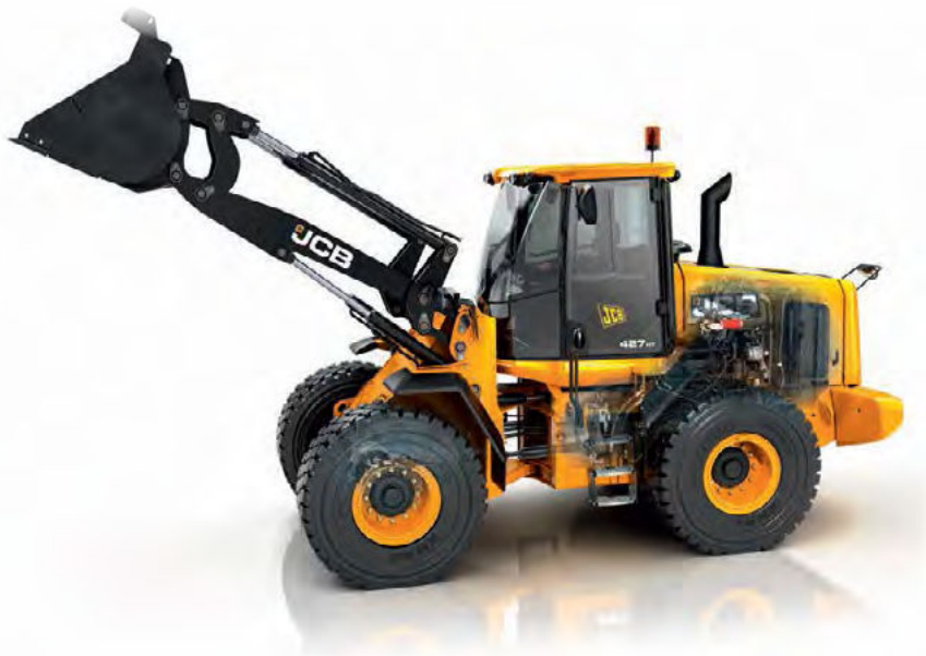
Obrázok 38: JCB 427 HT