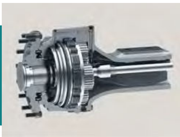
Obrázok 41: Plne hydraulické dvojokruhové brzdy s niekoľkými diskami ponorenými v oleji, čo zaručuje brzdovému systému bezúdržbový stav počas celej životnosti stroja