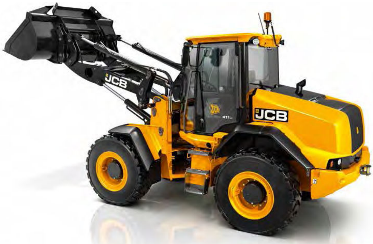
Obrázok 39: JCB 411 HT