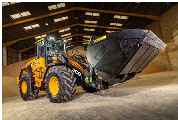
Obrázok 35: Práca s komoditami - JCB 427 HT AGRI