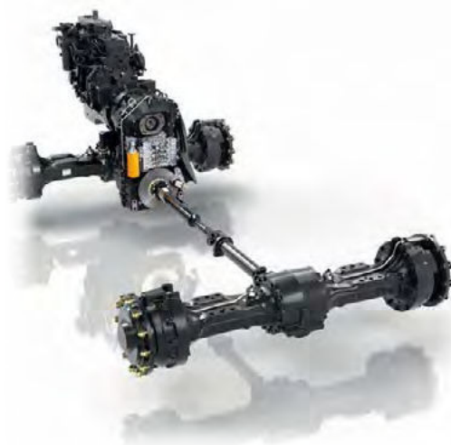
Obrázok 40: Diferenciály LSD s obmedzeným preklzom alebo 100 % uzávierkou na prednej náprave