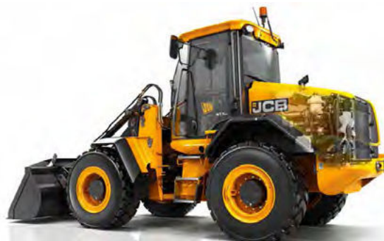
Obrázok 37: JCB 417 HT