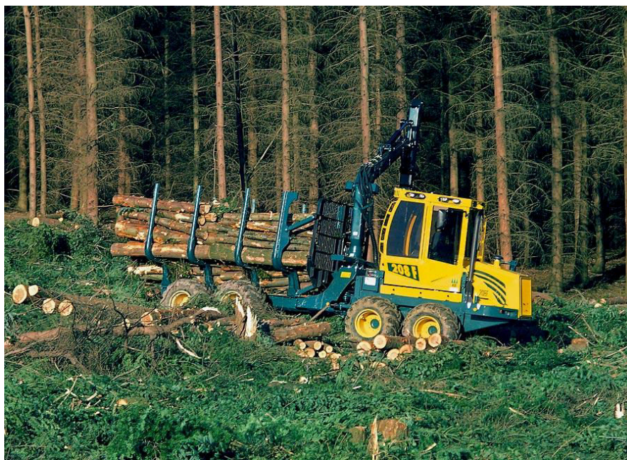
Obrázky jsou informativní