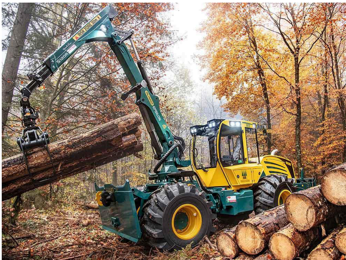
Obrázek je pouze informativní a obsahuje prvky výbavy na přání.